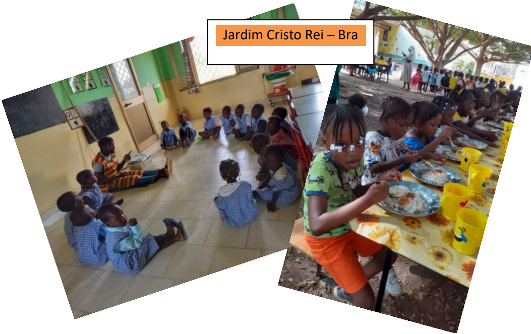
Jardim Cristo Rei – Bra