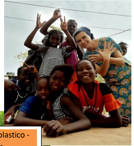
Sostegno scolastico - Brene